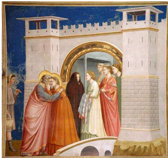
Giotto, le rendez-vous à la Porte dorée, 1303-1306, église de l'Arena, Padoue.

Rien dans les Évangiles n'évoque les origines familiales de la Vierge : on n'y découvre ni le nom de ses parents ni la manière dont elle fut conçue. Pour en connaître davantage sur sa vie, il faut se tourner vers l'Évangile apocryphe de Jacques (IIe après J.-C.), intitulé Nativité de Marie. Révélation de Jacques .